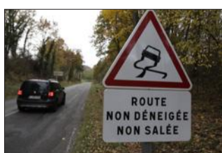
La montée des Trois-Épis...

Christophe Odermatt, délégué FO, balaie d'un revers de main l'argument du conseil départemental selon lequel « 80 % » des Haut-Rhinois sont équipés. « Une couche de glace se forme lorsque la neige se tasse, après des passages répétés. Vous croyez que vos pneus neige adhèrent sur la glace ? Non ! Le verglas constitue le problème principal ; on peut se faire surprendre, dans le Ried en particulier où les pièges sont nombreux. » Le syndicaliste s'interroge également sur cette recherche d'économie par les élus. « 210 000€ ont déjà été dépensés en panneaux de signalisation », relève M. Oder-