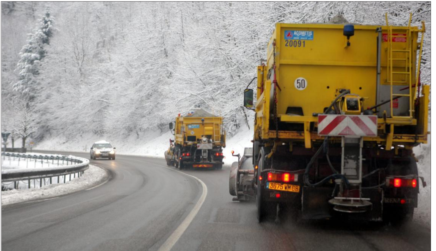
Pendant l'hiver 2013, entre Hachimette et Kaysersberg, des engins de déneigement s'activent sur la RD 415, axe prioritaire dégagé de 3 h à 20 h.